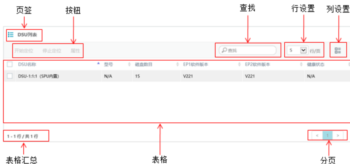
图3-8 ODSP Scope+信息显示区示例

信息显示区如图 3-8 所示，采用多页签的方式，通过表格直观地显示当前选中的导航树节点的详细信息。