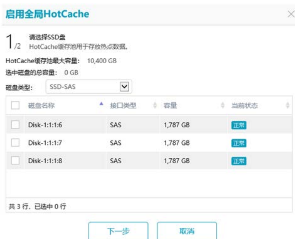
图5-1 启用 HotCache 界面

步骤 2：启用全局 HotCache 向导第一步如图 5-1 所示，选择用于创建 HotCache 缓存池的 SSD 盘，单击<下一步>按钮进入下一步界面。