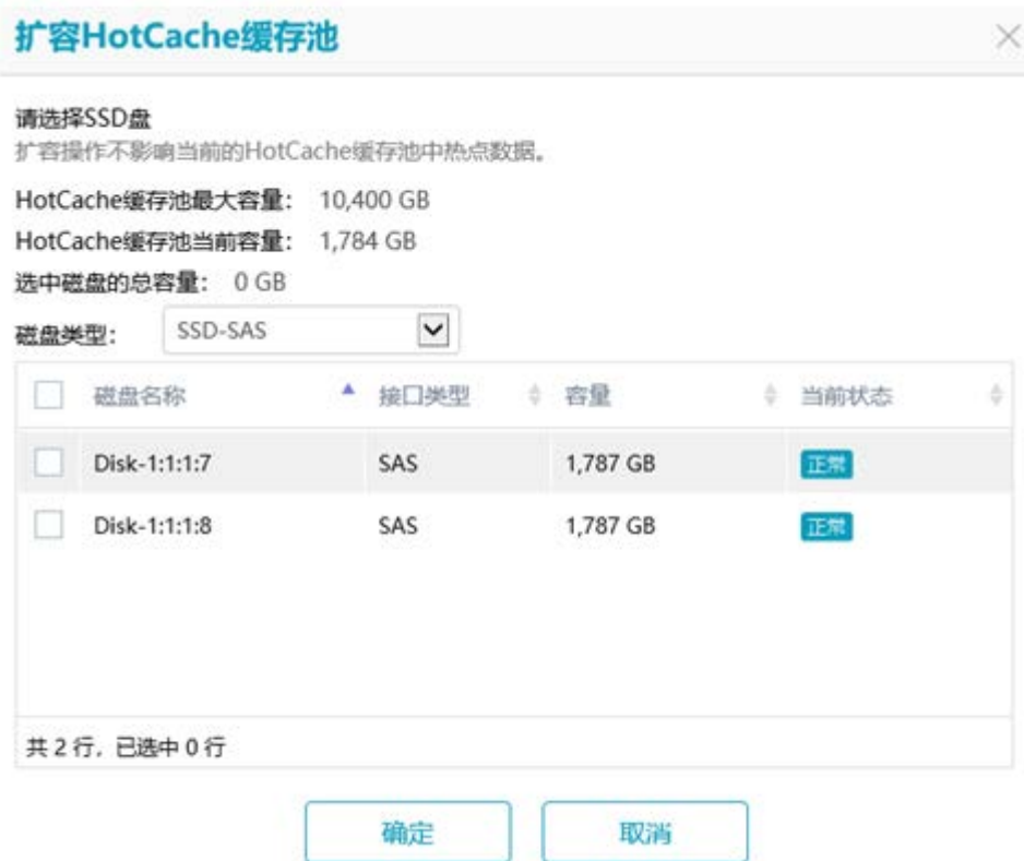
图5-2 扩容 HotCache 界面

在导航树上选择“存储服务”->“HotCache”，打开 HotCache 界面，在信息显示区的全局 HotCache 页签中单击<扩容>按钮，打开扩容 HotCache 窗口，如图 5-2 所示，选择用于扩容 HotCache 缓存池的 SSD 盘，单击<确定>按钮完成配置。