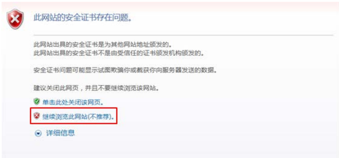
图3-1 证书异常提示界面示例

ODSP Scope+登录界面如图 3-2 所示，默认采用本地用户登录，单击“高级”还可选择采用 LDAP 用户登录，输入用户名和密码，点击<登录>按钮登录存储设备。