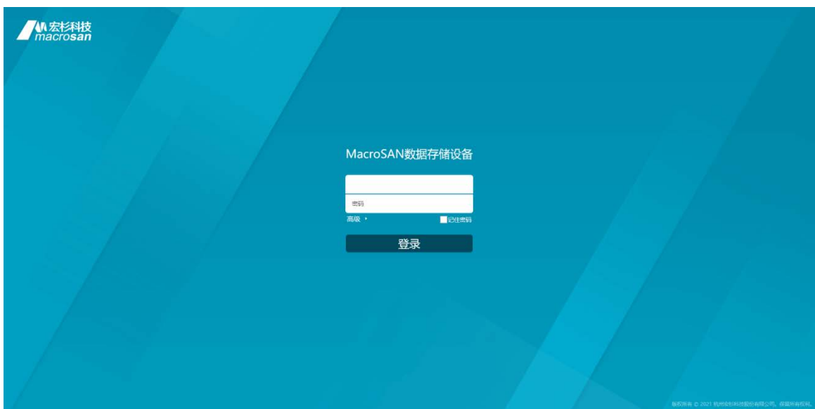
图3-2 ODSP Scope+登录界面

ODSP Scope+登录界面如图 3-2 所示，默认采用本地用户登录，单击“高级”还可选择采用 LDAP 用户登录，输入用户名和密码，点击<登录>按钮登录存储设备。