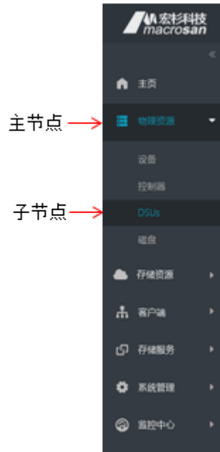
图3-5 ODSP Scope+导航树示例

导航树如图 3-5 所示，采用树状视图，以节点的方式展示存储设备的管理主节点，包括主页、物理资源、存储资源、客户端、存储服务、系统管理、监控中心等，单击任一主节点则可展开该主节点所属的子节点，单击任一子节点后可以对该子节点进行管理。