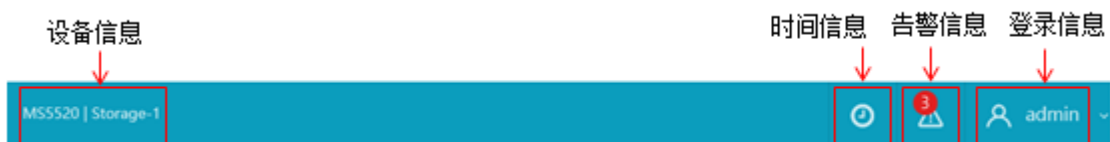
图3-6 ODSP Scope+导航栏示例