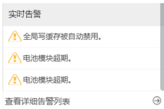
图3-7 ODSP Scope+告警项示例