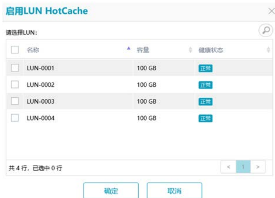
图5-3 启用 LUN HotCache 界面

在导航树上选择“存储服务”->“HotCache”，打开 HotCache 界面，在扩展区的启用 HotCache 的 LUN 列表页签中单击<启用>按钮，打开启用 LUN HotCache 窗口，如图 5-3 所示，选择需要启用 HotCache 的 LUN，单击<确定>按钮启用 LUN HotCache。