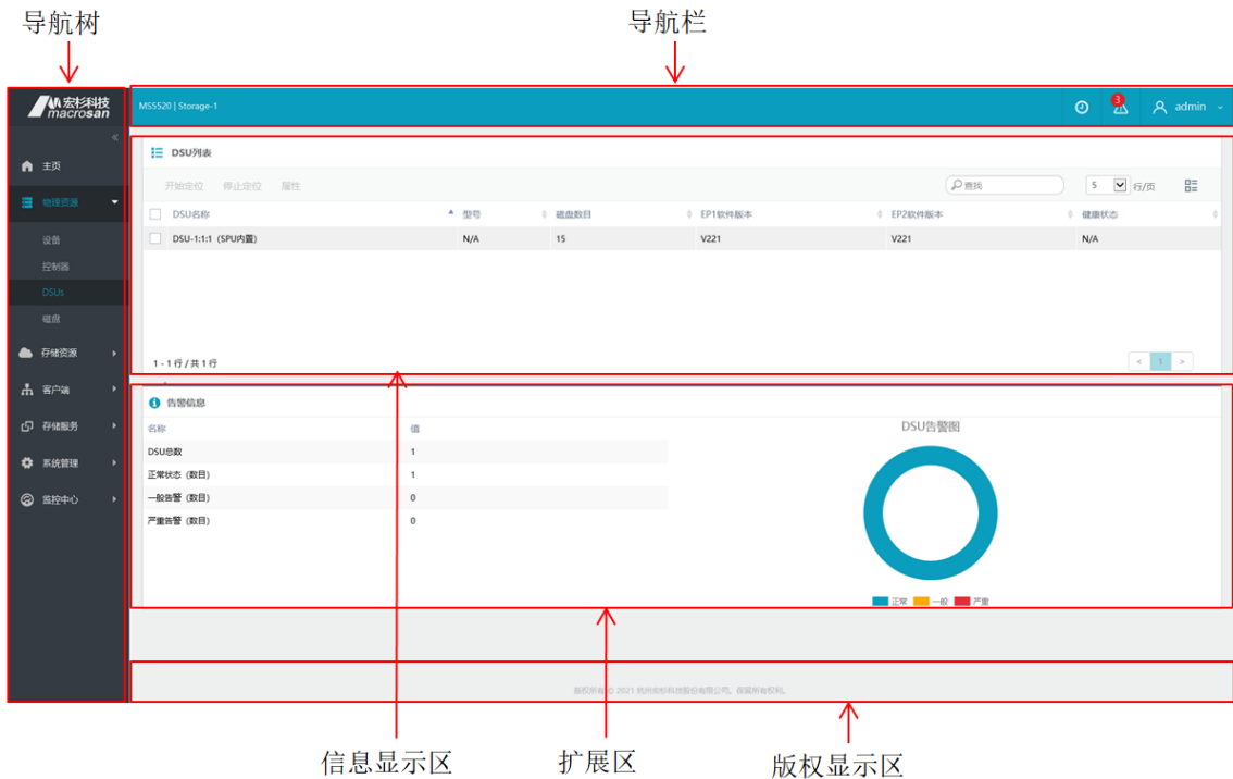
图3-4 ODSP Scope+典型界面示例

ODSP Scope+界面中将展示存储设备的所有信息，典型界面如图 3-4 所示，可划分为 5 个分区，分别对应导航树、导航栏、信息显示区、扩展区和版权显示区。